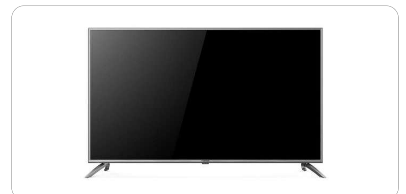
Телевизор с функцией Smart TV