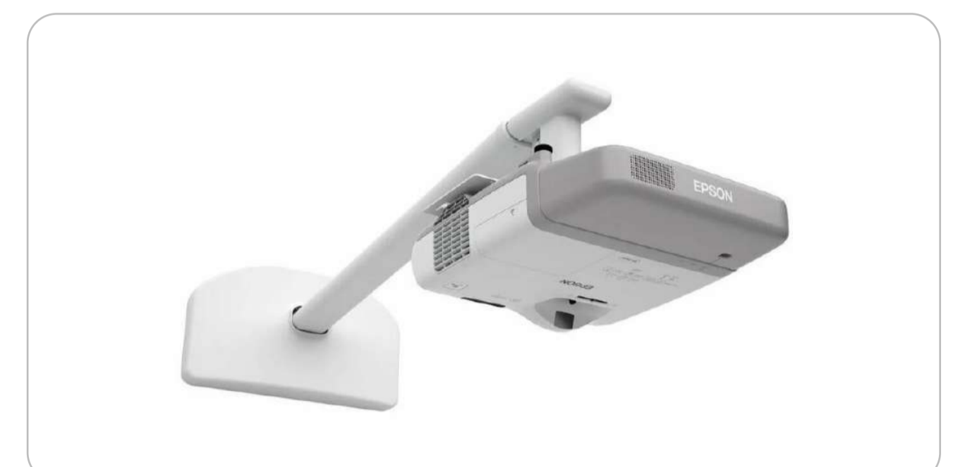
УКФ проектор с настенным креплением