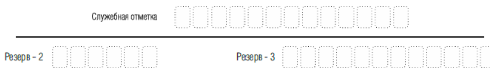
Рис. 5. Поля для служебного использования

Поля для служебного использования «Служебная отметка», «Резерв-2» и «Резерв-3» не заполняются.