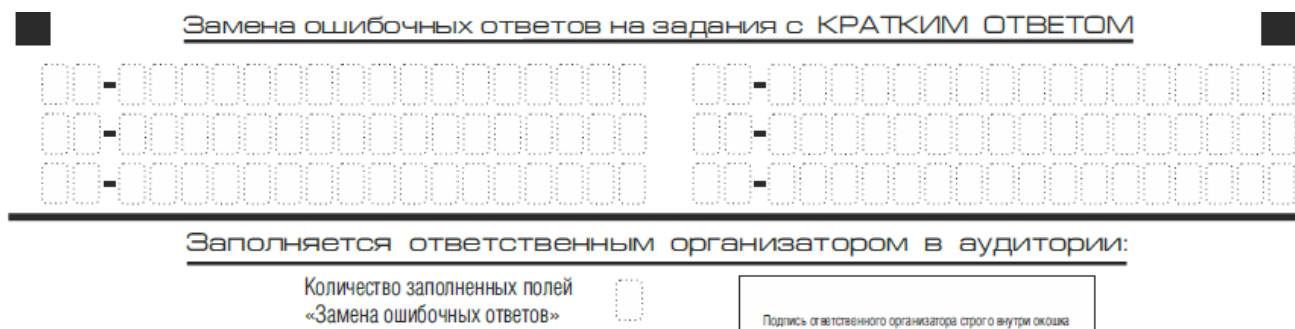
Рис. 9. Область замены ошибочных ответов на задания с кратким ответом

Запрещается записывать ответ в виде математического выражения или формулы. В ответе не указываются названия единиц измерения (градусы, проценты, метры, тонны и т.д.) – так как они не будут учитываться при оценивании. Недопустимы заголовки или комментарии к ответу.